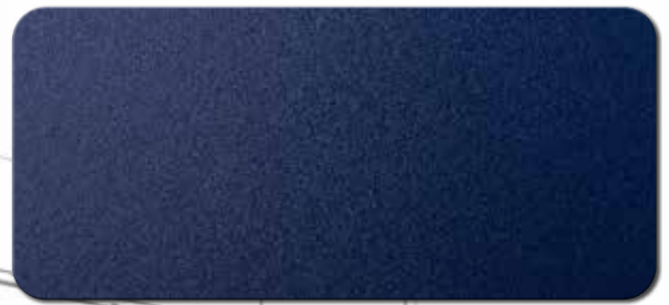
PF1001FRA526 RAL 5026 PERLNACHTBLAU MATT