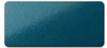
PF1003FRA525 RAL 5025 PERLENZIAN