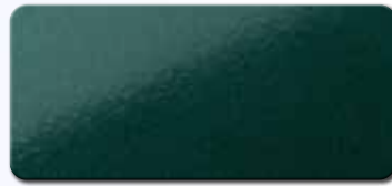
PF1003FRA636 RAL 6036 PERLOPALGRÜN