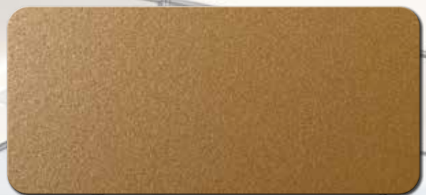
PF1001FRA136 RAL 1036 PERLGOLD MATT