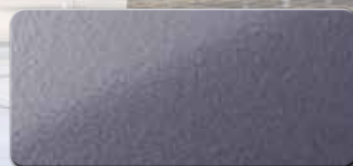
PF1003FRA412 RAL 4012 PERLBROMBEER