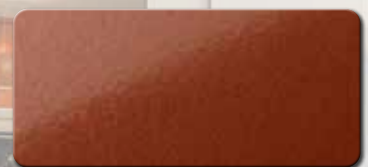
PF1003FRA829 RAL 8029 PERLKUPFER