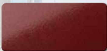
PF1003FRA332 RAL 3032 PERLROBINROT