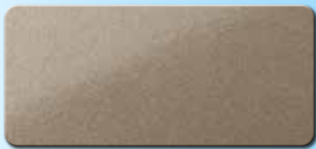
PF1003FRA135 RAL 1035 PERLBEIGE