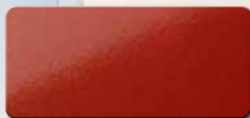
PF1003FRA333 RAL 3033 PERLROBINROT