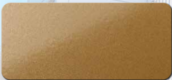
PF1003FRA136 RAL 1036 PERLGOLD SDGLZ.