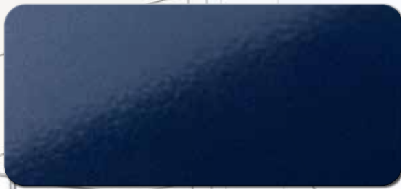
PF1003FRA526 RAL 5026 PERLNACHTBLAU SDGLZ.