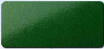
PF1003FRA635 RAL 6035 PERLGRÜN