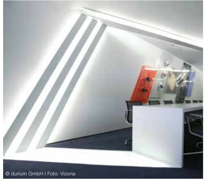
Innenleuchten Interior lighting