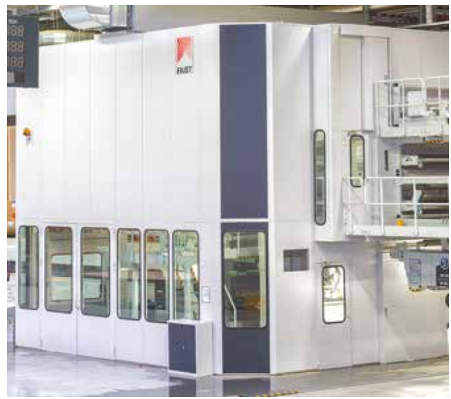
Metaldecken und Raumsysteme Ceiling panels and room systems