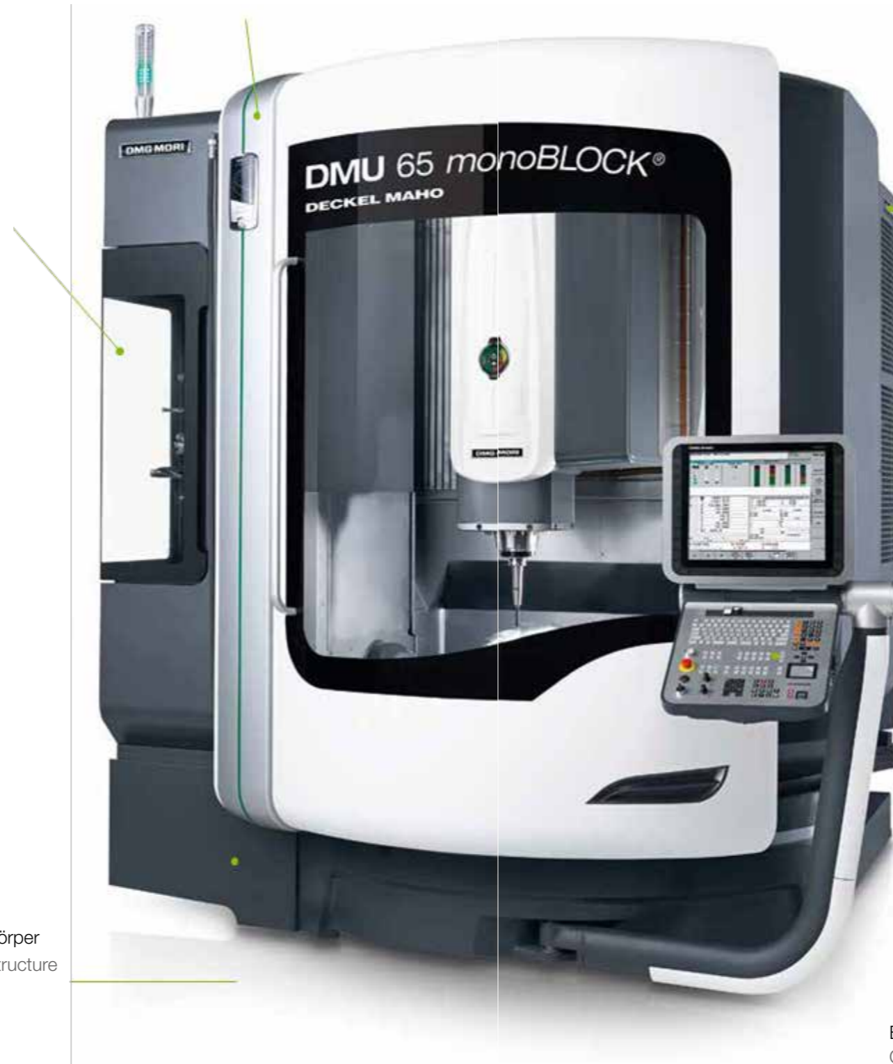
Grundkörper Basic structure